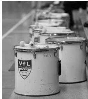
Fans und Trommler der Handballer - zuhause und auswärts stark!

Die Busfahrt ist kostenlos, Trommler erhalten eine Freikarte für den Eintritt.