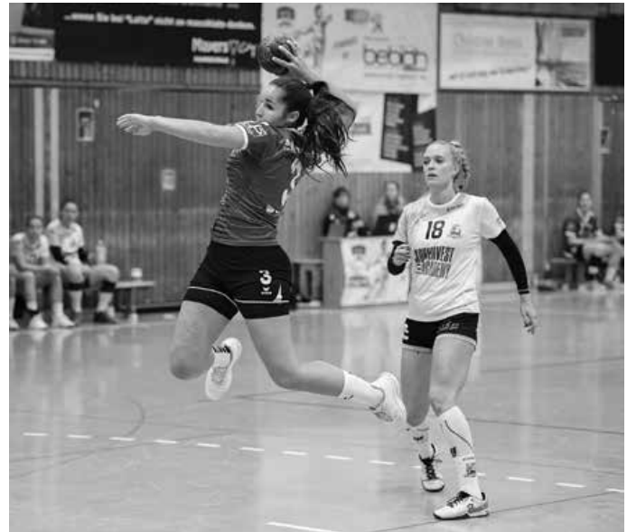
Fokussiert gehen die VfL-Damen ins Derby gegen Herrenberg.

14:30 Uhr mC LL 2: JSG - HSG Rottweil 15:00 Uhr mB BWOL: TuS Helmlingen - JSG 16:15 Uhr mA WOL 2: JSG - MTG Wangen 17:00 Uhr mA BL: JSG 2 - TV Großengstingen (Hofbühlhalle) 18.01.2020, 18:00 Uhr Herren KL: VfL 3 - SG Nebr/Reust 2 18.01.2020, 20:00 Uhr Herren LL: VfL 2 - TSV Köngen 19.01.2020, 11:15 Uhr wB BL: VfL - Spvgg Mössing. 19.01.2020, 13:00 Uhr wA BL: VfL - SV Leonb/Elt 19.01.2020, 15:00 Uhr Frauen BL: VfL 3 - SG Nebr/Reust 19.01.2020, 17:00 Uhr Herren 3. Liga: TV Willstätt - VfL Abfahrt Fan-Bus: 13.15 Uhr an der Kurt-App-Halle 19.01.2020, 17:00 Uhr Frauen WL: VfL - H2Ku Herrenb. 2