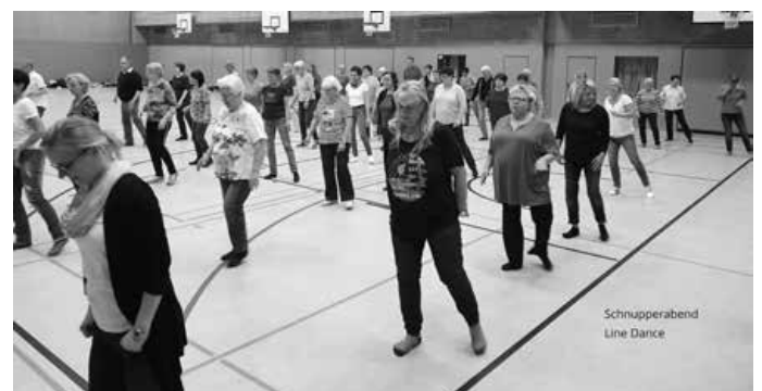
Schnupperabend Line Dance