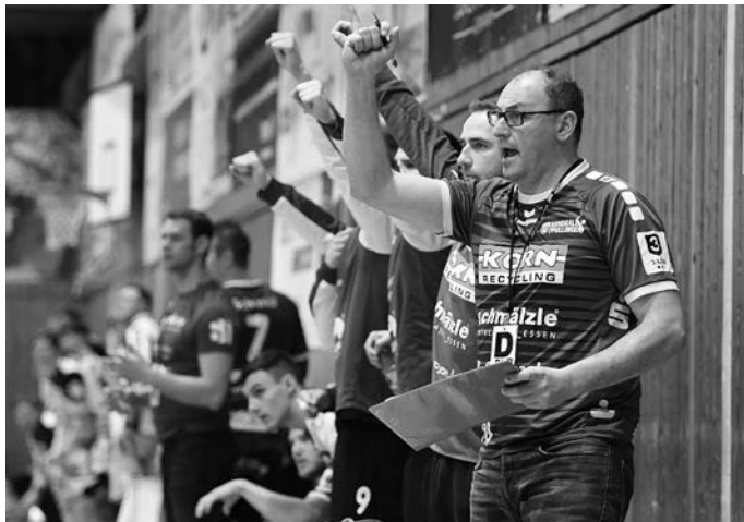
So wie hier möchten die Drittligaherren am Samstagabend auch in HaBloch jubeln.