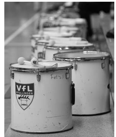
Fans und Trommler der Handballer - zuhause und auswärts stark!

Die Busfahrt ist kostenlos, Trommler erhalten eine Freikarte für den Eintritt.