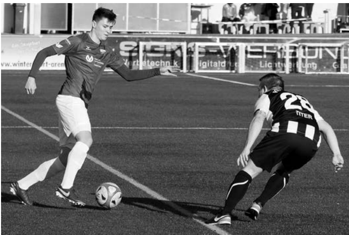
Für den VfL beginnt die Mission Klassenverbleib gegen den SV Fellbach.

Volksbank-Stadion; Hinspiel 3:1 für den VfL.