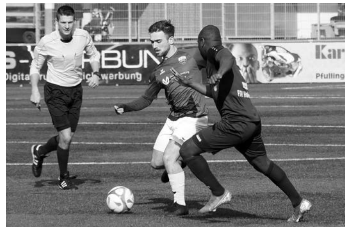
In Ehingen wartet die nächste Hürde auf den VfL.

Abfahrt des Mannschaftsbusses ist pünktlich um 12.15 Uhr. Fans dürfen gerne mitfahren.