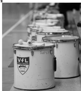
Fans und Trommler der Handballer - zuhause und auswärts stark!

Die Busfahrt ist kostenlos, Trommler erhalten eine Freikarte für den Eintritt.