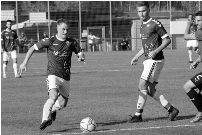
Die Verbandsligakicker empfangen den Tabellenzweiten aus Hollenbach.