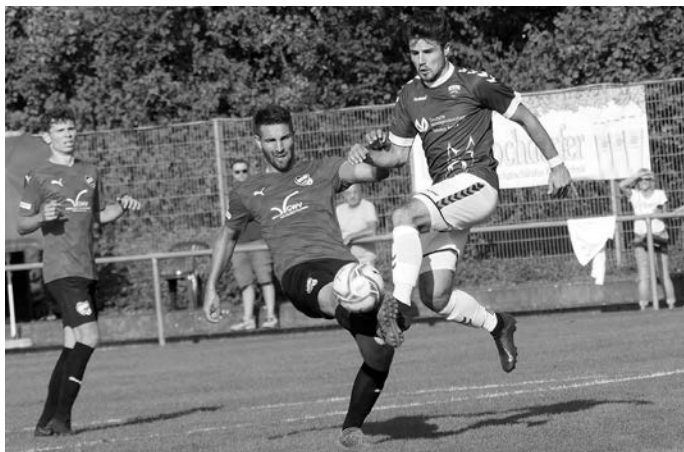
Für die Pfullinger Verbandsligakicker geht es am Sonntag in Württembergs Nordosten.