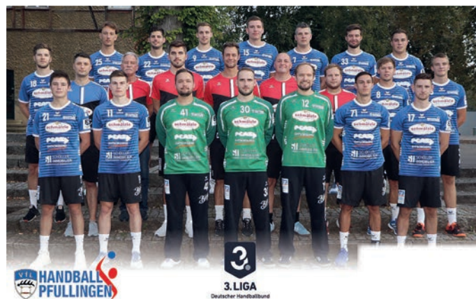
Mannschaftsbild der Drittligaherren.