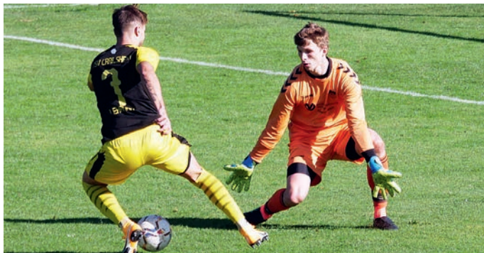
Gegen Heiningen soll der nächste Heimsieg her