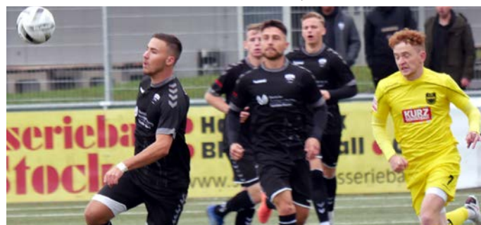
Um ein Abrutschen auf einen Abstiegsplatz zu verhindern, sollte gegen die TSG ein Sieg her.

VfL - TSG Hofherrnweiler-Unterrombach, Volksbank-Stadion