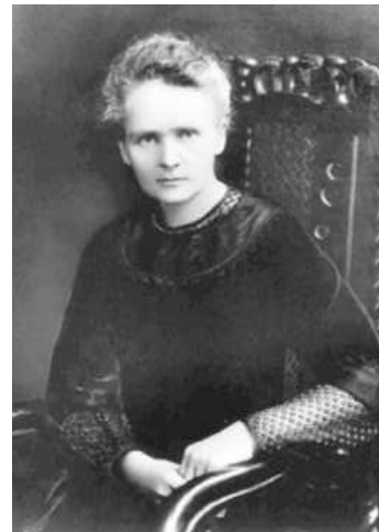
Marie Curie, Birmingham, 1913.

am 04. Juli 1934 die Physikerin, Chemikerin und zweifach Nobelpreisträgerin Marie Curie im Sanatorium Sancellemoz in Passy verstarb.