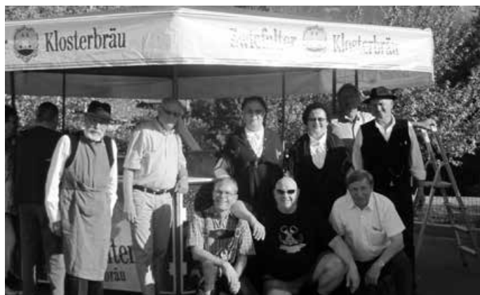
Bierstand in Passy 2014

Und nun laden wir Sie alle ein, bei einer geplanten Reise nach Passy zum Zwetschgenfest am 1. Oktoberwochenende 2021 die Freundschaft in Passy zu erleben und die 13 Teilorte kennenzulernen. Nähere Informationen werden folgen.