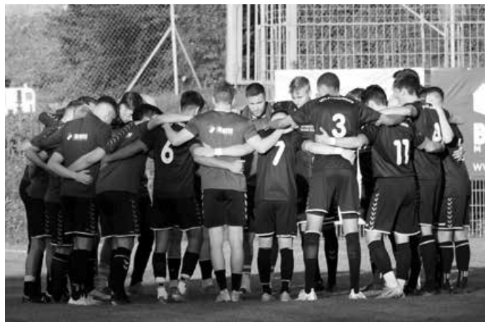
Gemeinsam zum Erfolg.