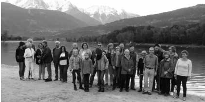
Am Lac de Passy, 2016

Wir freuen uns auf Ihre Anmeldung und laden Sie herzlich ein, sich an der Reise zu beteiligen!