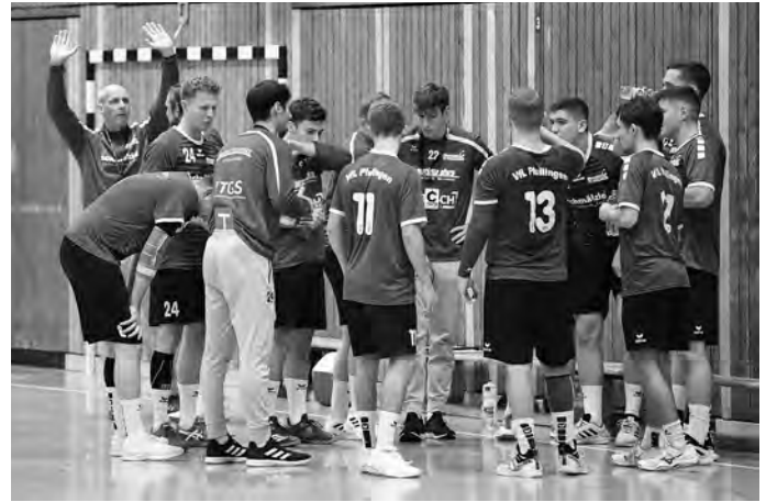
Der VfL Pfullingen 2 startet in die neue Saison.

Während die Drittligahandballer des VfL Pfullingen am Sonntag bereits ihr drittes Saisonspiel bestreiten, starten einige Jugendmannschaften sowie die 2. Männermannschaft der Pfullinger Handballer an diesem Wochenende in die neue Spielrunde.