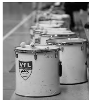
Fans und Trommler der Handballer - zuhause und auswärts stark!

Anpfiff ist um 17.00 Uhr in der Schafhausäckershalle, Carl-Orff-Weg 4, 73207 Plochingen