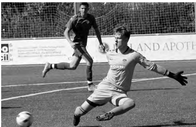
Ab sofort ist auch für die Pfullinger Junioren-Verbandsstaffelteams voller Einsatz gefragt.

Bitte beachten: Bei den Heimspielen gelten die Vorgaben unseres Hygienekonzepts, zu finden unter www.vfl-info.de