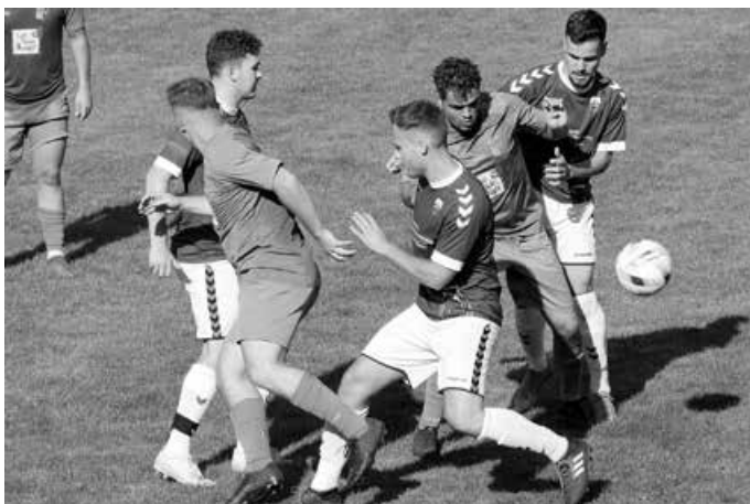
Die U23 muss im Pokal auswärts ran.