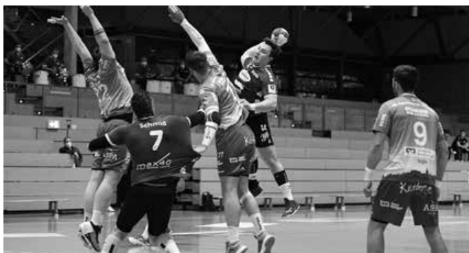
Die Drittligahandballer sind beim HCOB zu Gast.