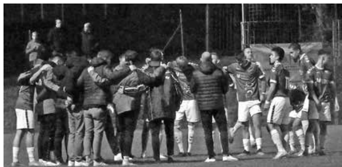
Zusammenhalt ist bei der Herausforderung in Schwäbisch Gmünd sehr wichtig.

1. FC Normannia Gmünd - VfL Jahnstadion Schwäbisch Gmünd