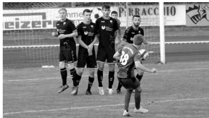
Gegen die SGM Dettingen/Glems will die U23 ihren Aufwärtstrend fortsetzen.

Bitte beachten: Bei den Heimspielen gelten die Vorgaben unseres Hygienekonzepts, zu finden unter www.vfl-info.de