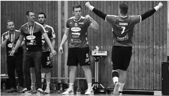
Männer 1 haben den TSV Neuhausen/Filder zum Derby zu Gast.

Informationen zum M1-Spiel: Tickets gibt es im Vorverkauf auf der Webseite der Pfullinger Handballer oder - wenn noch vorhanden - am Samstag an der Abendkasse. Einlass nur mit 3G-Regel, es gilt Maskenpflicht!