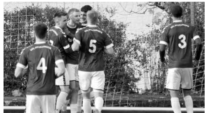
Beim Namensvetter in Sindelfingen möchten die Pfullinger Verbandsligakicker ebenfalls punkten.

Floschenstadion-Kunstrasenplatz Sindelfingen