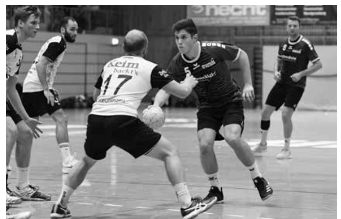
Männer 2 empfängt die TSG Reutlingen zum Derby.