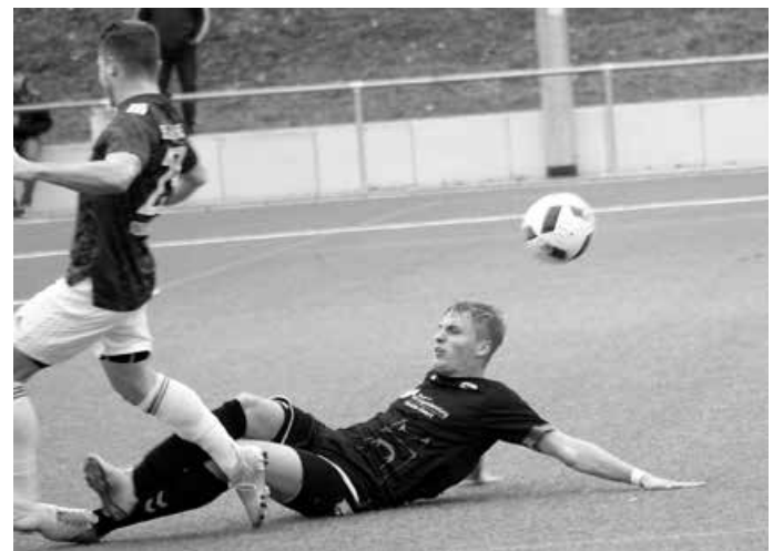
Im letzten Auswärtsspiel der Vorrunde steht der VfL unter Druck.