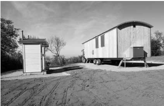
Der erste Bauwagen des Naturkindergartens Urschel steht bereits seit dem 18. Oktober auf seinem Platz in der Nähe des Spielplatzes Hägle.