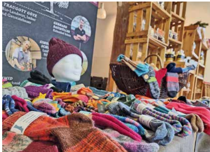
Nach Weihnachtsmarktabsage: Im BeckaBeck gibt es jetzt auch Strickwaren zu kaufen.