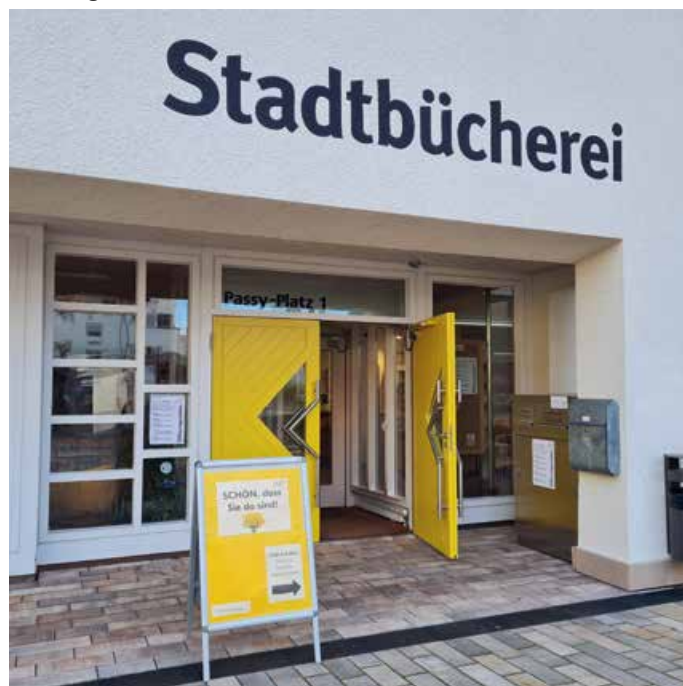
Pfullinger Stadtbücherei: Der Haupteingang hat einen neuen Öffnungsmechanismus