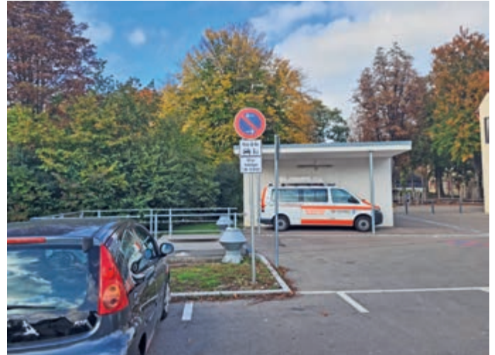
Neue „Kiss & Go“-Zone auf dem Parkplatz.

Gemeinsam sollen diese Maßnahmen zu mehr Sicherheit und Übersicht auf dem Schulweg beitragen. Dazu gehört auch der Aufruf insbesondere an die Autofahrerinnen und Autofahrer insbesondere zu den Stoßzeiten rücksichtsvoll und vorsichtig zu fahren.