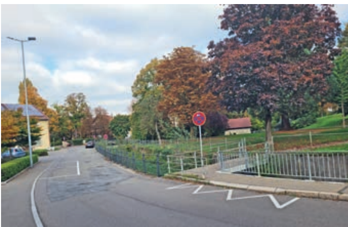
Ausgeweitetes Halteverbot in der Schloßstraße, ebenso zwei neu eingezeichnete Parkplätze.

Seit vergangener Woche gelten in der Schloßstraße daher neue Regeln – die entsprechenden Schilder wurden bereits angebracht und die Markierungen sind auf dem Boden zu finden. Künftig gibt es zum einen ausgeweitete Sperrflächen und damit größere Halteverbotsbereiche in der Schloßstraße selbst. Ersatzweise wurden an geeigneter Stelle zwei neue Parkplätze eingezeichnet. Zum anderen gilt in Zukunft vor den Garagen des DRK-Gebäudes ein Halteverbot. Umgekehrt wurde am nördlichen Ende des Park-