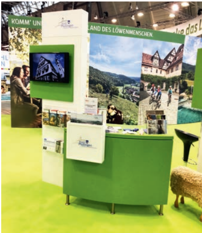
Der Pfullinger Messestand auf der CMT in Stuttgart.

Der Stand befindet sich in Halle 6 im Bereich der Schwäbischen Alb. Die Messe ist täglich vom 14.01.2023 bis 22.01.2023 von 10.00 Uhr bis 18.00 Uhr geöffnet und mit dem Schnellbus eXpresso direkt von Pfullingen aus erreichbar.