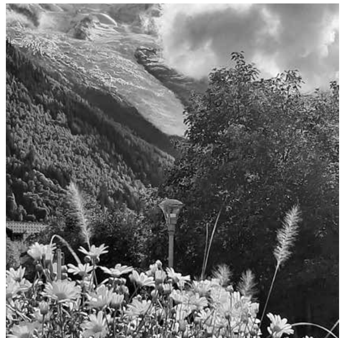
Chamonix mit Blick zum Mont blanc

Bitte beachten Sie auch unsere Internetpräsentation mit aktuellen Informationen zur Städtepartnerschaft: http://www.partnerschaft-passy-pfullingen.de/