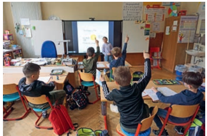
Die Klasse 3a sammelt gemeinsam Ableitungswörter.

Seit dem 18. April sind alle Klassenzimmer der Laiblinsschule Pfullingen mit digitalen Tafeln ausgestattet. Dies ist Teil der Digitalstrategie, die die Stadt Pfullingen vorantreibt. Im Zuge dessen wurden die letzten verbliebenen Kreidetafeln entfernt und die neuen digitalen Tafeln montiert. Die Laiblinsschule war auch übergangsweise bereits gut ausgerüstet, da die Möglichkeit bestand, seit Mitte des letzten Schuljahres in allen Klassenzimmern Beamer und Dokumentenkameras aufzustellen. Damit konnte die Zeit bis zur digitalen Tafel überbrückt werden, erklärt Schulleiterin Kirsten Stengl-Mozer.