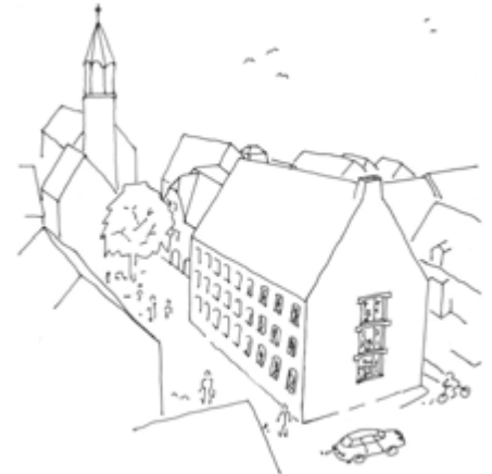
Skizze des Rathausergänzungsgebäudes aus den Entwürfen von Architekt Eberhard Wurst beim Planungswettbewerb 2021.

So geht es aus der Vorinformation an die Bürgermeisterämter im Regierungsbezirk Tübingen hervor. Das Geld ist für den anstehenden Neubau des Rathausergän-