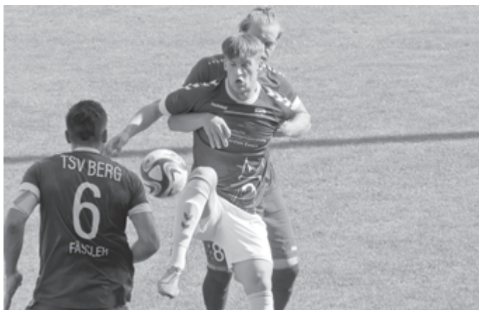
Der VfL will am Sonntag bei Aufsteiger TV Echterdingen bestehen.