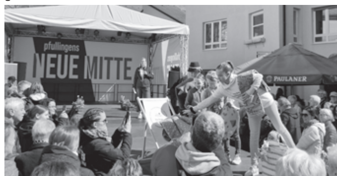
Los ging's mit dem Frühlingserwachen, unter anderem mit Modenschau.

Die Jüngsten wurden nicht vergessen, kamen selbst auf ihre Kosten etwa beim FamilyDay des VfL, beim 10-jährigen Jubiläum des Schülerladens PULS oder beim i'kuh-Kinderprogramm am Nachmittag. Und auch der lokale Einzelhandel sah nicht tatenlos dabei zu, wie sich in seiner Mitte die Menschen sammelten. Gewerbe und Handel riefen zu eigenen Aktionen, nicht zuletzt flankierten mit dem Frühlingserwachen und dem Pfulbenhock bei verkaufsoffene Sonntage die Feierlichkeiten. Aber auch die Dolce Vita brachte italienisches Flair auf den neuen Marktplatz und mit ihm zahlreiche „Heimat-Urlauber“, die das süße Leben auf der NEUEN MITTE zu genießen wussten.