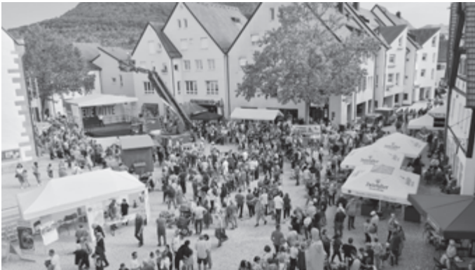
Vorführung der Feuerwehr als besonderes Pfulbenhock-Highlight.

Die NEUE-MITTE-Rubrik auf der städtischen Homepage gibt es nach wie vor. Dort soll bald eine Bildergalerie einen visuellen Rückblick auf diese besonderen Wochen auf dem Pfullinger Marktplatz liefern. Und auch ein bisschen Vorausblick sei erlaubt: Die Vorbereitungen für eine Fortsetzung im nächsten Jahr laufen bereits - Zeitraum, Größe und Programm sind aber noch offen. Die Stadt informiert, sobald es Genaueres zu erfahren gibt - ebenfalls unter www.pfullingen.de/neuemitte .