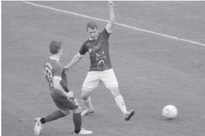
Am Freitagabend will der VfL gegen den Aufsteiger drei Punkte am Jahnhaus behalten.