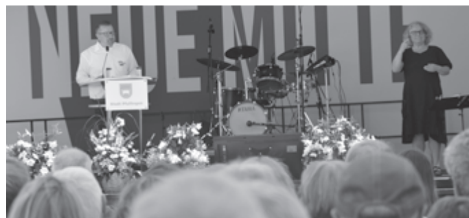
Rede des Bürgermeisters beim Open-Air-Bürgerempfang.

Und wo so viel Musik spielt, kann der Tanz nicht fern sein: Die Tanzschulen und -gruppen der Stadt lieferten nicht nur atemberaubende Bühnenshows, sondern raubten dem Publikum bei so mancher Mitmach-Tanzaktion im wahrsten Sinne den Atem. Gemeinsam sporteln auf dem Marktplatz – auch das hat die NEUE MITTE möglich gemacht.