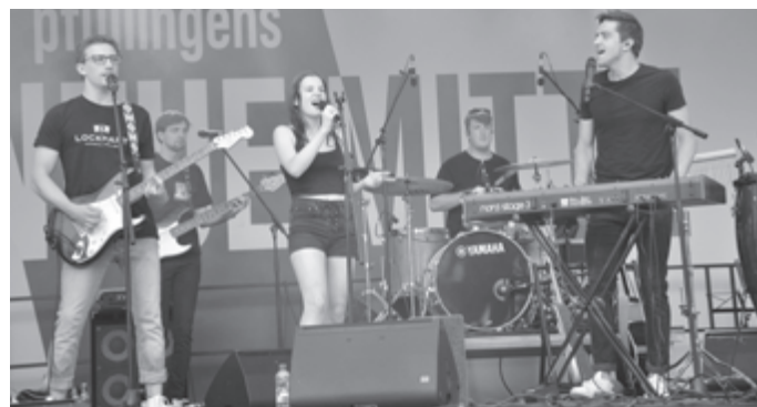
Die Musikschulbands waren der krönende Abschluss beim "Sommerfest".

ausfordernden Wetterbedingungen – lieferten unter anderem die Musikvereine, Orchester aller Couleur, Gesangsvereine, die Städtische Musikschule wie auch Bands und private Ensembles. Es gab Rock, es gab Jazz, es gab maximale Party und es gab gefühlvolle Chorstimmen – all das auf der NEUE-MITTE-Bühne in Pfullingen.