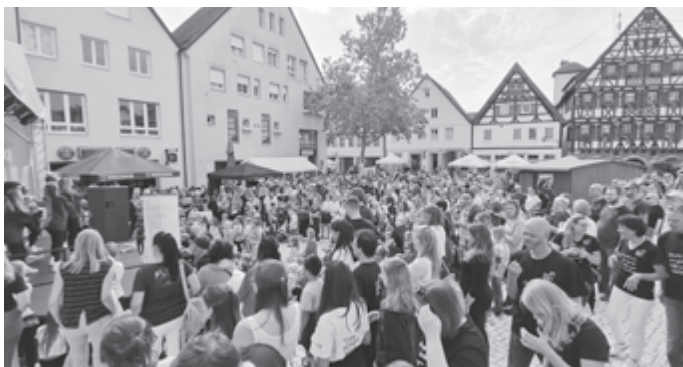
Ein Meer aus Menschen beim Pfulbenhock - nicht nur auf der Bühne wird getanzt.

Im Mai 2021 begannen die umfangreichen Bauarbeiten zur Neugestaltung des Pfullinger Marktplatzes. Im Frühjahr 2023 wurden diese fertiggestellt und Pfullingens NEUE MITTE feierlich eingeweiht. Anstelle eines einmaligen Stadtfestes gab es eine ganze Reihe an Festen, Konzerten, Darbietungen, Marktaktionen und Feierlichkeiten, die von Ende März bis Anfang Oktober die Pfullingerinnen, Pfullinger und auch Gäste der Stadt auf dem Marktplatz zusammenbrachten – gefördert vom Ministerium für Wirtschaft, Arbeit und Tourismus Baden-Württemberg.