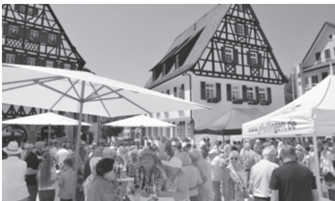
Der Bürgerempfang im Juni bei hochsommerlichen Temperaturen.