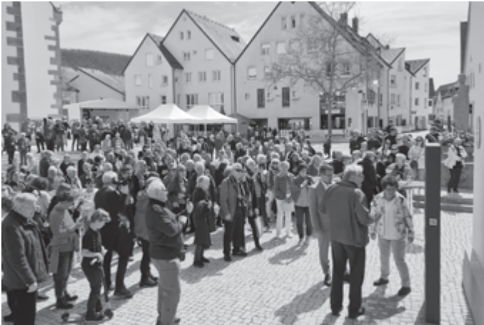
Großes Publikum bei der Einweihung der Erinnerungsstele.

die Sportlerehrung auf und um die NEUE-MITTE-Bühne. Ein weiteres Highlight: Der „Sommertag“ der drei Stadteinrichtungen Bücherei, vhs und Musikschule, der seinem Namen alle Ehre machte.