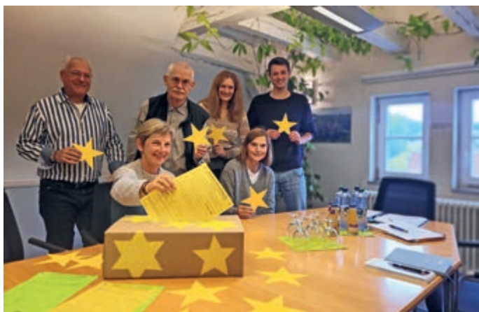
Das Orga-Team hält die Pfullinger Wunschsterne schon bereit.

Im ersten Schritt gilt es nun, die Wunschzettel an die Kinder zu verteilen. Dafür müssen sich die Familien selbst beim Pfullinger BÜRGERSERVICE im DEZ (Kirchstraße 17) melden: Teilnahmeberechtigt ist, wer eine gewisse Bedürftigkeit nachweisen kann, also etwa als Empfänger von Wohngeld, Arbeitslosengeld, Kinderzuschlag oder Grundsicherung. Die Aktion richtet sich speziell an bedürftigere Kinder bzw. Familien, deswegen ist dieser Nachweis zu Beginn wichtig. Im BÜRGERSERVICE erhalten sie dann direkt den Wunschzettel, den sie später ausgefüllt auch dort wieder abgeben. Die Aktion hat bereits am 30. Oktober begonnen – letzter Tag zur Abgabe der ausgefüllten Wunschzettel ist der 10. November.