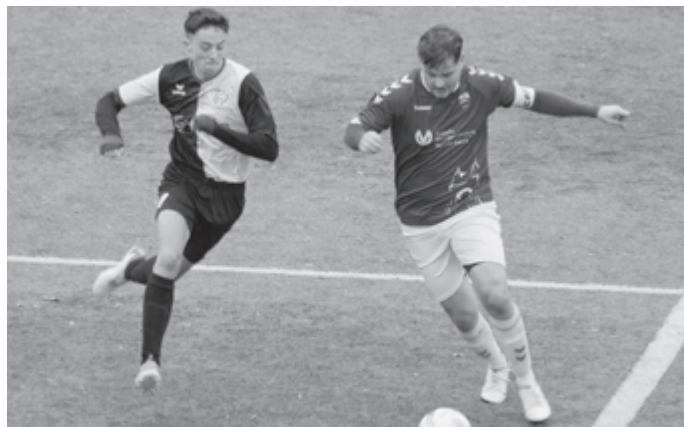
Zum Auftakt der Rückrunde erwartet die dritte Mannschaft zum Duell Erster gegen Zweiter den TSV Sickenhausen II.