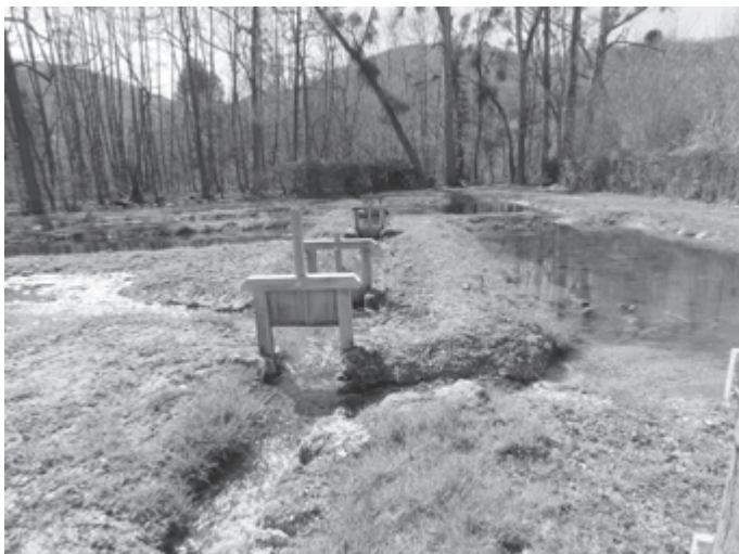
Renaturierung der Bernau-Teiche.

Kommende und bereits existierende Herausforderungen machen auch vor Pfullingen nicht halt. Klimawandel und der Verlust von Biodiversität erfordern Lösungen und Handlungen vor Ort. Und es braucht ein Zusammenwirken Aller zum Wohle der Natur und der Bürger:innen.