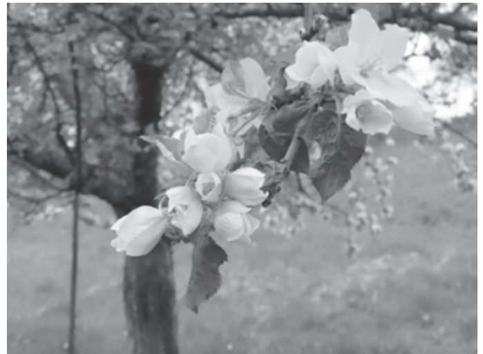
Revitalisierung alter Streuobstbäume

Die umgesetzten Projekte spiegeln die Diversität der Naturschutzarbeit in unserer Kommune. Mit den Äpfeln von städtischen Streuobstwiesen wurde Schulpfirsich hergestellt, es gab Fledermausführungen und Vorträge und Maßnahmen zur Förderung von Wildbienen. Neben Öffentlichkeitsarbeit und Umweltbildung wurden auch etliche Naturschutzprojekte unterstützt und gefördert, wie die Durchführung fachgerechter Obstbaumschnitte, Einrichtung einer Amphibienleitung oder die Anlage von Blumen- und Streuobstwiesen.