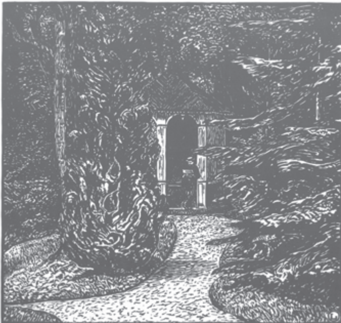
Wilhelm Laage: Das Gartenhaus (Park Laiblin, Holzschnitt, 1913)

Abgabe: bis 18. Februar 2024 auf Homepage Pfullingen