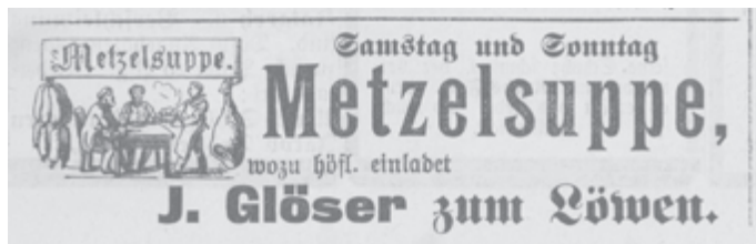
Grafik: Anzeige im „Echatz-Bote“ vom 10. Januar 1903

Anlässlich des bundesweiten TAGS DER ARCHIVE, der in diesem Jahr unter dem Motto „Essen und Trinken“ steht, bietet das Stadtarchiv in einem Vortrag Einblicke in die oft krisenbehaftete Geschichte der hiesigen Ernährung und ihre Grundlagen. Das Ganze steht unter der Überschrift „Vom Hungertumult zur „Fresswelle“ - archivarische Einblicke in die Pfullinger Ernährungsgeschichte“.