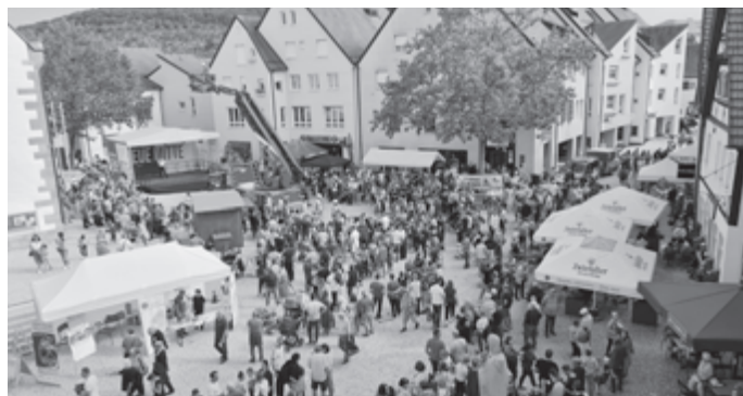
Feuerwehr-Einsatzdemonstration beim Pfulbenhock in der NEUE MITTE

Die Pfullinger Kultur, die Vereine, die Bildungseinrichtungen der Stadt und die Verwaltung arbeiteten Hand in Hand, um Pfullingens NEUE MITTE in ihrem Eröffnungshalbjahr mit Leben zu füllen. Am 8. Oktober ist die Veranstaltungsreihe mit dem Pfulbenhock zu Ende gegangen - in diesem Jahr soll es nun aber weitergehen, wenn auch mit reduzierter Zeitspanne.