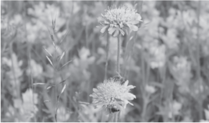
Wildblumen wie die Wiesen-Knautie können auch im eigenen Garten angepflanzt werden und erfreuen sich großer Beliebtheit.