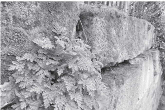
Die Fugen dieser Trockensteinmauer bieten Pflanzen und Insekten ein Zuhause. Aber auch andere Tiere wie Eidechsen fühlen sich hier wohl. Solche „Spezialbiotope“ tragen wesentlich zur Erhöhung der Artenvielfalt im eigenen Garten bei.