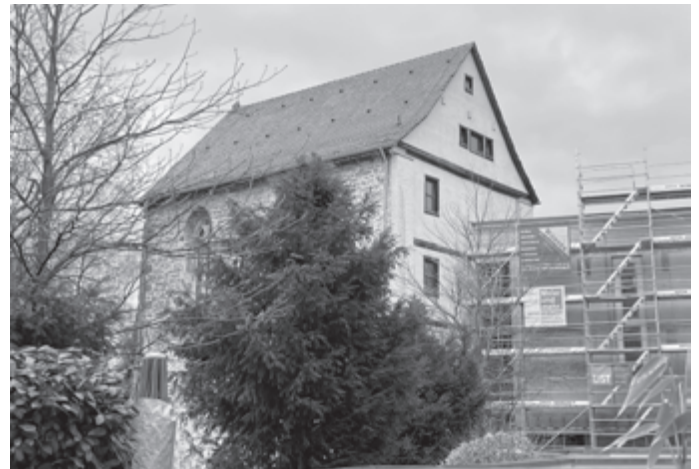
Von rechts her kommend nimmt der Anbau, der die historische Klosterkirche unter anderem um ein Treppenhaus ergänzen wird, deutlich Konturen an.