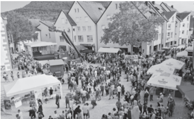
Feuerwehr-Einsatzdemonstration beim Pfulbenhock in der NEUEN MITTE

Die Pfullinger Kultur, die Vereine, die Bildungseinrichtungen der Stadt und die Verwaltung arbeiteten Hand in Hand, um Pfullingens NEUE MITTE in ihrem Eröffnungshalbjahr mit Leben zu füllen. Am 8. Oktober ist die Veranstaltungsreihe mit dem Pfulbenhock zu Ende gegangen - in diesem Jahr soll es nun aber weitergehen, wenn auch mit reduzierter Zeitspanne.