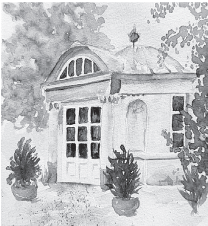
Das Bild des Monats des Pfullinger Geschichtsvereins nimmt einmal mehr den Laiblinpavillon in den Fokus.