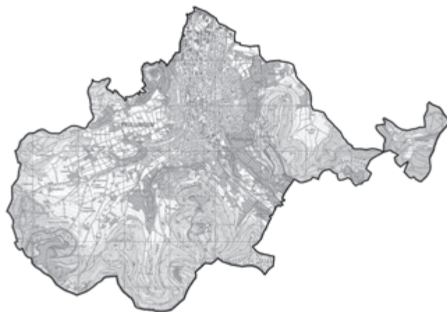
Grafik: Die Kernflächen (lila hinterlegt) dienen als Ausgangsbiotope und sollen vernetzt werden.

Nur 30 bis 40 % der Tier- und Pflanzenarten können dauerhaft durch die aktuell vorhandenen Schutzgebietsinseln erhalten werden. Deshalb ist ihre Vernetzung und Aufwertung durch Biotopverbünde so wichtig.