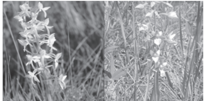
Weiße Waldhyazinthe ( Platanthera bifolia )

Hier die richtigen Fotos zu den Namen der Orchideen, fotografiert mittels Teleobjektiv, immer vom Weg aus. Prof. Waltraud Pustal.