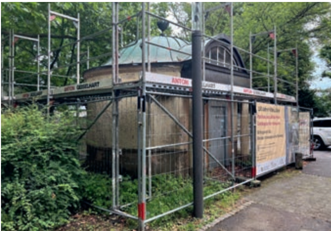
Der eingerüstete und eingezäunte Pavillon im Laiblin-Park.

Das momentan von Bauzäunen verdeckte Gartenhaus, das seit Jahren unter eindringender Feuchte und Vandalismus leidet, soll bis zum Herbst 2025 zu einem Lieblingsort für Kleinkunst saniert werden. Ein solches Vorhaben ist nur durch großzügige Fördermittel und Spendengelder zu realisieren. Die Spendensumme beläuft sich aktuell auf 32.700 Euro. Damit wird sich ungefähr ein Viertel der Maßnahme finanzieren lassen. Ein großer Dank gilt hier allen Spendern, die ein so schönes Projekt unterstützen!