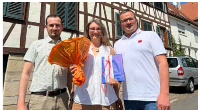
Abschied vor dem heutigen Pfullinger Rathaus III (das ehemalige ist das Gebäude, das vor einigen Monaten dem anstehenden Rathausneubau weichen musste.)

men sozusagen, das sie in den letzten Jahren der Berufstätigkeit nochmal aufs Neue fordern sollte - insbesondere in der Zeit der Corona-Pandemie.