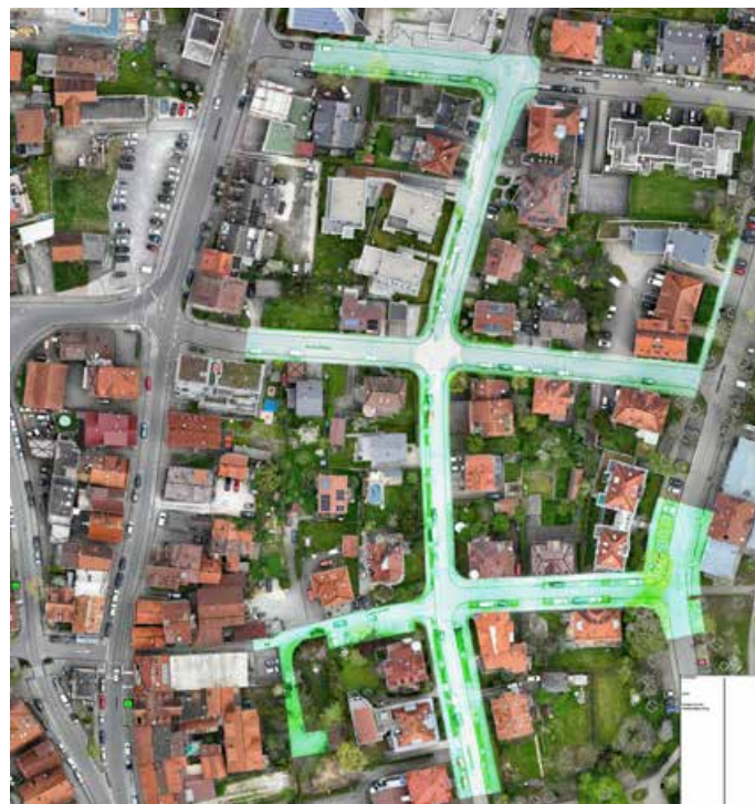
Grafik: Übersichtskarte erstes Ausbaugbiet der UGG um die obere Kaiserstraße

„Ich freue mich, dass wir in Pfullingen nun mit dem Ausbau der Breitbandinfrastruktur beginnen können“, betont Stefan Wörner. „Die Bauarbeiten werden aber für die Anwohner und Verkehrsteilnehmer auch Beeinträchtigungen mit sich bringen, dafür bitten wir um Verständnis“, so der Bürgermeister, der sich glücklich darüber zeigt, dass diese kritische Infrastruktur für eine sichere digitale Zukunft in Pfullingen ohne Komplementärfinanzierung durch die Stadt flächendeckend geschaffen werden kann. „Die OEW baut mithilfe von Fördermitteln aus, die übrigen Gebiete übernimmt die UGG mit eigenwirtschaftlichen Mitteln. Bei einem Gesamtinvestitionsvolumen von grob 100 Millionen Euro steht da also ein mehr als beachtlicher Betrag dahinter, den die Stadt alleine nicht aufbringen könnte“, erläutert Stefan Wörner. Die andernorts übliche Mitfinanzierung durch städtische Mittel kommt im Pfullinger Fall nicht zum Tragen, was dazu führt, dass der Pfullinger Haushalt nicht belastet und andere wichtige Vorhaben davon nicht betroffen sein werden - aus Sicht der Stadt eine besonders günstige Situation.