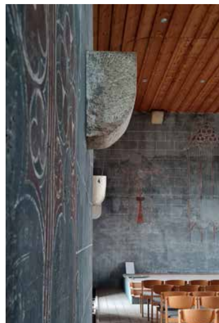
Saal in der historischen Klosterkirche

Der Tag des offenen Denkmals ist die größte Kulturveranstaltung Deutschlands. Seit 1993 öffnen die unterschiedlichsten Denkmäler in Deutschland, in diesem Jahr wieder weit über 5.000, ihre Türen für die interessierte Bevölkerung und bieten dazu noch ein absolutes Sonderprogramm - auch in Pfullingen: