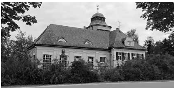
Wasserwerk Dettingen