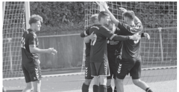
Die U23 möchte auch nach dem Spitzenspiel gegen Pfrondorf jubeln.