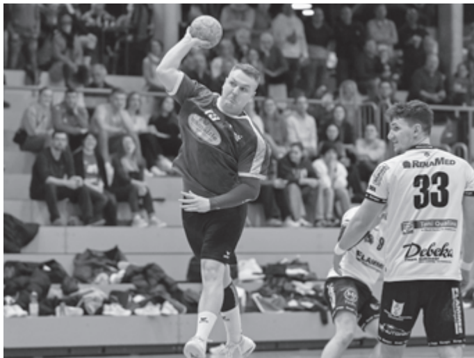
Männer 2 erwartet die SG Ober-/Unterhausen zum Derby in der Kurt-App Halle

14:15 Uhr SV Leonberg/Elt. - wD1 15:00 Uhr mD2 - TV Neuhausen/Erms 16:00 Uhr HSG Schönbuch 2 - F3 16:15 Uhr Spvgg Mössingen - wB 16:30 Uhr wC1 - Spvgg Mössingen 18:00 Uhr HSG Schönbuch - F2 18:15 Uhr wD2 - Spvgg Mössingen 19:00 Uhr SV Plauen-Oberlosa - M1 20:00 Uhr M2 - SG Ober-/Unterhausen ( DERBY! ) E-Jugendspieltag in Reutlingen und Rottenburg