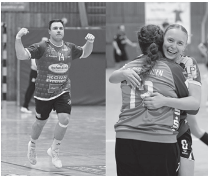
Derbytime in der Kurt-App Halle: Männer 1 empfängt Balingen, Frauen 1 Unterhausen