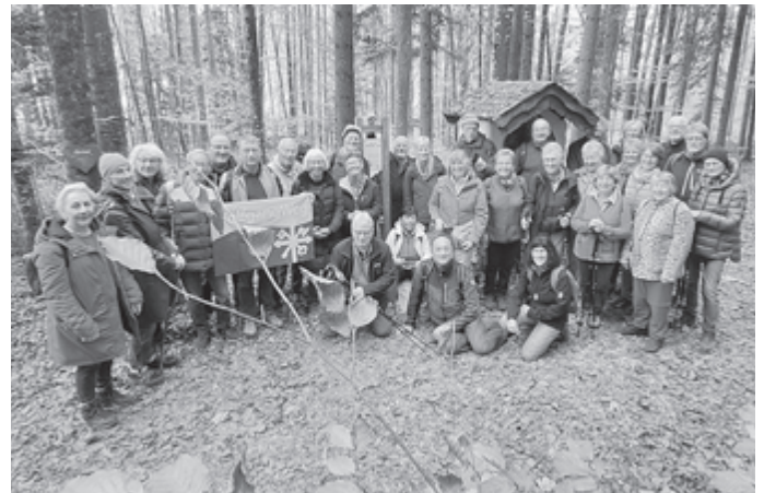
Foto: Die Reisegruppe am Raststein des hl. Wolfgang v. Pfullingen auf dem Falkenstein; eine Kopie davon befindet sich seit 1994 auf dem Kirchplatz St. Wolfgang in Pfullingen nunmehr neben der neuen Wolfgangskulptur von Annette Zappe

Den Nachmittag verbrachte ein großer Teil der Reisegruppe auf einer Fahrt mit der steilsten Zahnradbahn Österreichs auf den 1364 m hohen Schafberg, von dem man eine außergewöhnliche Sicht über das sich langsam lichtende Nebelmeer auf die Alpen hatte.