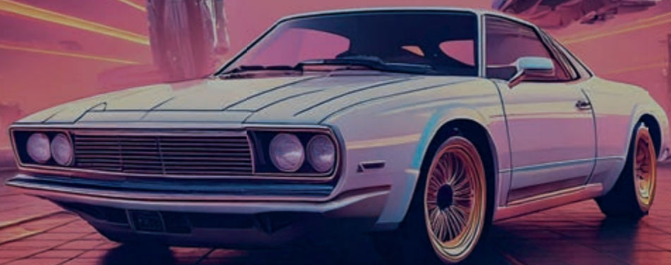
Bild ist KI-generiert

Samstag, 14. Dezember, 19:30 Uhr Pfullinger Hallen, Klosterstr. 110 Erwachsene 12 Euro, Kinder bis 14 J. 8 Euro Freie Platzwahl.