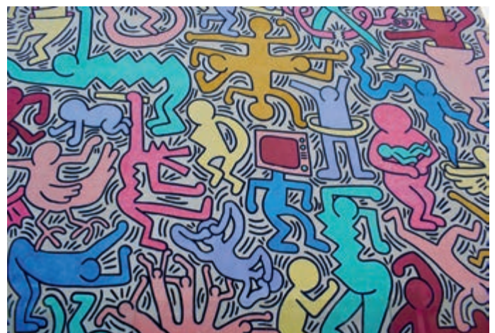
Keith Haring

Das Museum Brandhorst in München widmet sich mit der Ausstellung „Andy Warhol & Keith Haring. Party of Life“ zwei Ikonen der Kunstgeschichte. Über 120 Werke, gemeinsame Projekte und seltene Archivmaterialien laden dazu ein, den Kosmos der 1980er-Jahre neu zu entdecken - von Pop-Art und Graffiti bis hin zu MTV und Hip-Hop.